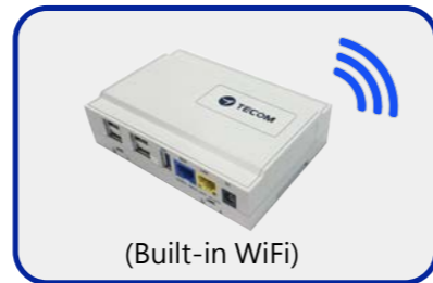
物聯網 (IoT) 網關 x 1