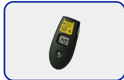
紅外線溫度偵測儀 x 1