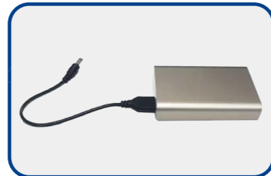
行動電源 (充電寶) x 1