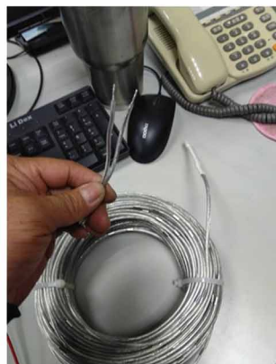
② 漏水線沒正負之分