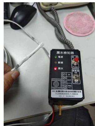
④ 接好潑水就會發報了