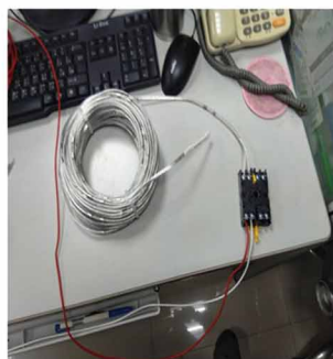
③ 記得線要打開避免短路